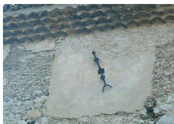
Avant la restauration côté Ouest (en haut) et Est (en bas)

Dans le cadre de la réfection de la toiture du Temple la commune de Pontaix a décidé de profiter de la pose des échafaudages pour faire restaurer les deux cadrans des horloges du clocher, situés sur les façades Est et Ouest.