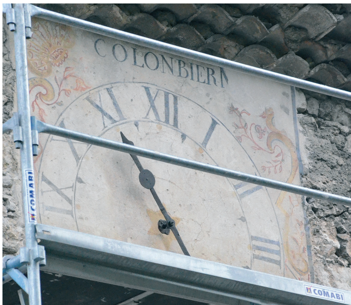
Le cadran côté Ouest en cours de restauration