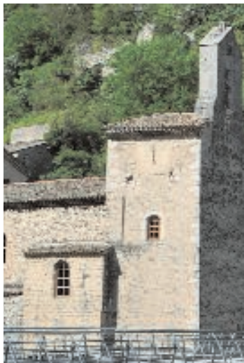
Avant la restauration, côté Drôme