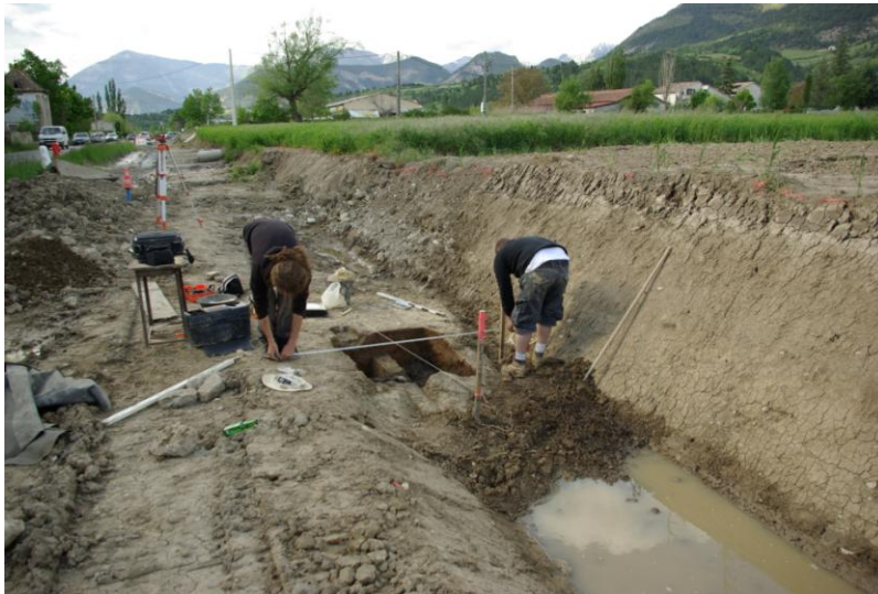
Vue générale du chantier. On distingue le trou du sondage entre les deux archéologues.

Plusieurs couches de cendres étant visibles dans la coupe, il est probable que l'emplacement a servi à plusieurs reprises.