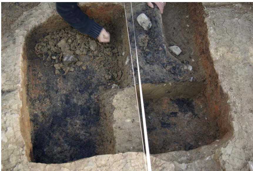
Gros plan sur le sondage. Les couches noires correspondent à des dépôts cendreux