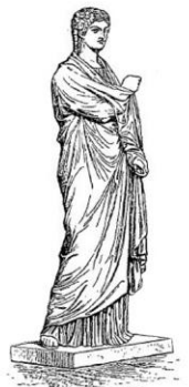
Exemplaire complet de même type

Statue romaine, partie inférieure de femme en robe plus grande que nature. 1 er ou 2 e siècle, marbre blanc Découverte à Die en septembre 2013, place de la République. Cette statue devait orner à l'origine le forum public de la ville ou un jardin privé.