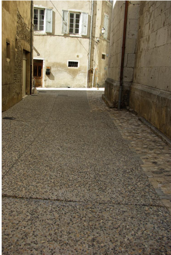
Rue Notre-Dame, état des travaux le 12 septembre 2013

Du côté de la rue Notre-Dame, les travaux vont bon train. La construction d'une calade, le long du mur de la cathédrale se poursuit activement tandis que, dans la bande de circulation, les premiers mètres carrés du nouveau revêtement ont été coulés cette semaine.